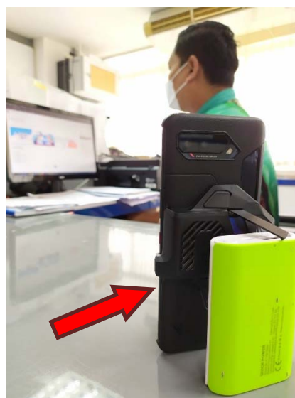
อุปกรณ์ชิ้นที่ 2 ใช้เปิดโปรแกรม ZOOM Cloud Meetings