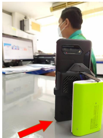
อุปกรณ์ชิ้นที่ 2 ใช้เปิดโปรแกรม ZOOM Cloud Meetings